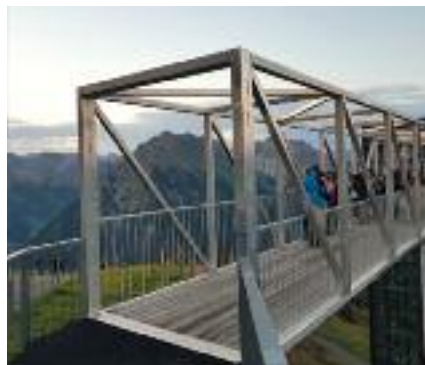
Übergang an der Bergstation Walmendingerhorn

Wer hier an die christliche Taufe, die Konfirmation, Hochzeit, Goldene Hochzeit und Beerdigung, an Gottesdienste zu Einführungen und Verabschiedungen denkt, ist genau richtig.