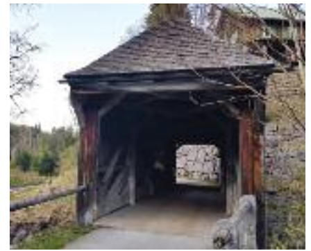
Alte Leidtabelbrücke über die Breitach

Und am entgegengesetzten Übergang vom Sein zum Nicht-Sein spricht Gott durch die Worte der Apokalypse im 21. Kapitel „Siehe, ich mache alles neu.“