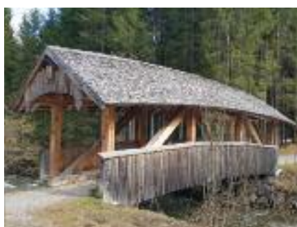
Übergang am Schwarzwasserbach